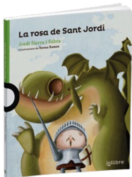
La rosa de Sant Jordi Jordi Sierra i Fabra