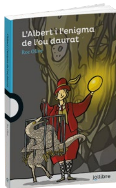
L'Albert i l'enigma de l'ou daurat Roc Olivé