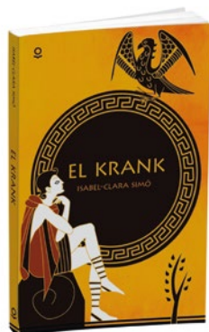
El krank Isabel-Clara Simó